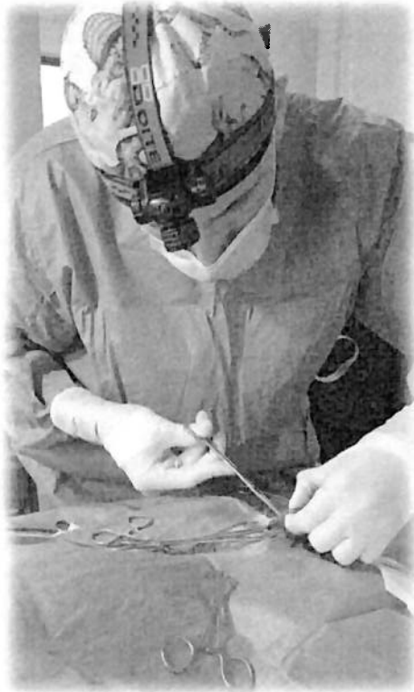
Registro fotográfico de cirugía de aseo quirúrgico y plastia asociada a herida antigua con hipergranulación.