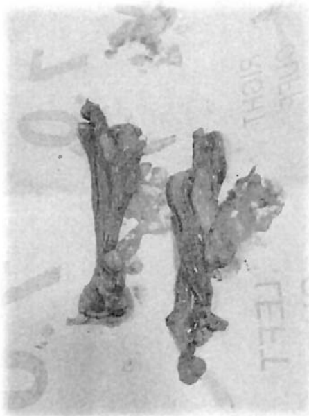
Cuernos uterinos y ovarios poliquísticos, extraídos de una paciente canina con múltiples ciclos reproductivos.